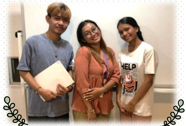
タダー チマトーイ レアッカナー