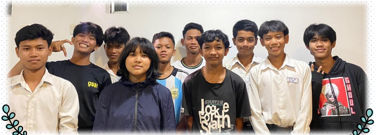
奥： ポップ シャンハイ マカラ スナー ウェイ 手前： メンホン ロサナー サンバ ウイトゥー ペイ